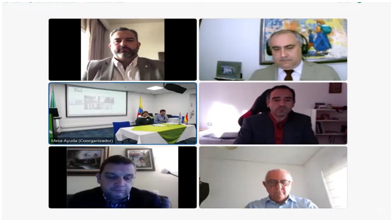
IV Congreso Internacional de Mediación en Colombia. 2022

Dous docentes do IES Carlos Casares que participan na proposta de Oberva_Acción, interviron, un cómo ponente experto (o director do centro) e outro como moderador, nunha mesa redonda sobre a análise dos puntos débiles que a mediación escolar atopa nos centros educativos; no IV Congreso Internacional de Mediación , que tivo lugar na Fundación Universitaria del Área Andina , en Bogotá (Colombia). (27, 28 de outubro 2022).