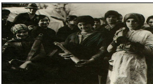
Rapazas de Romanía nunha fábrica de armamento en Italia durante a IGM