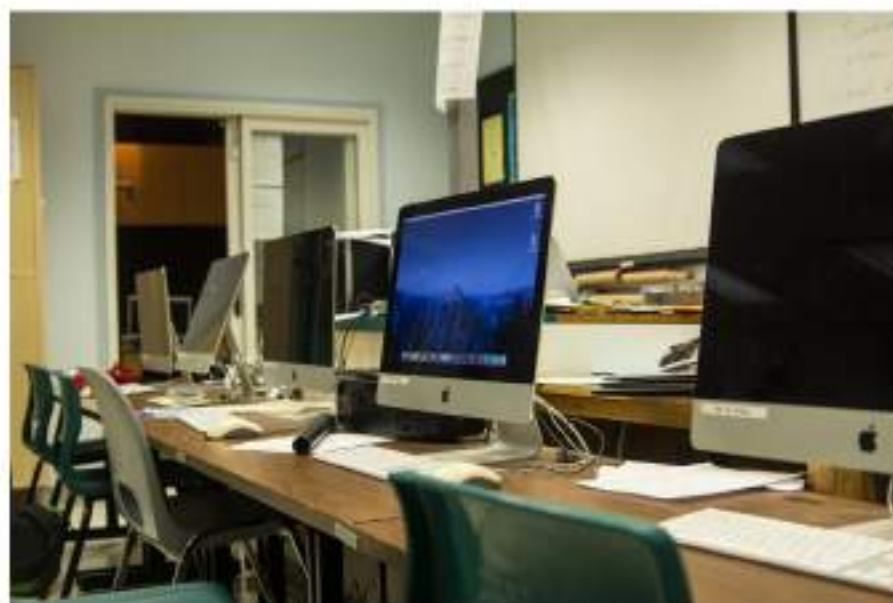
Espazo para a postproducción