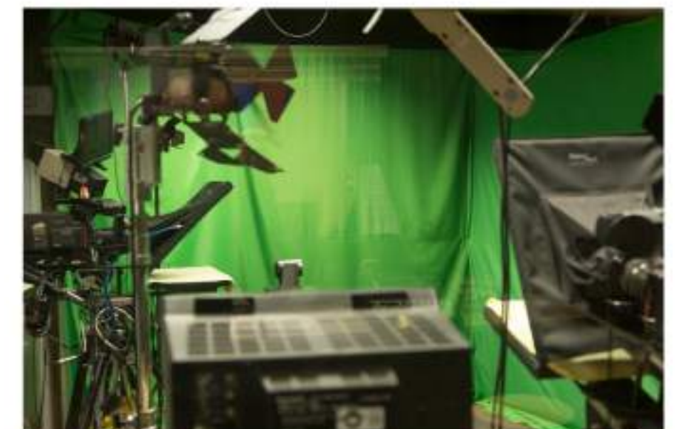
Espazo para a gravación con Chroma Key