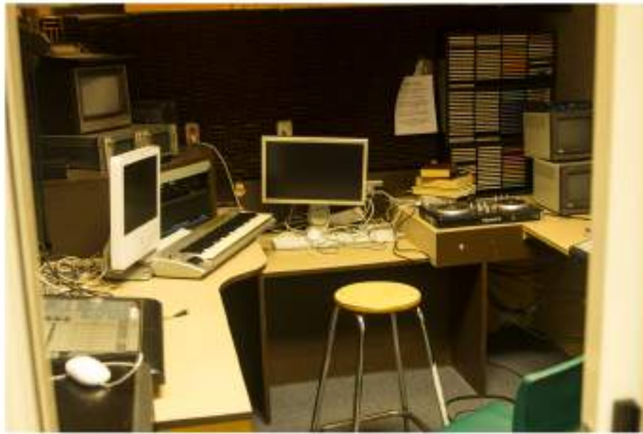
Emisora de Radio

Aquí temos o exemplo da realización diaria dun programa de televisión e a súa emisión en cada aula