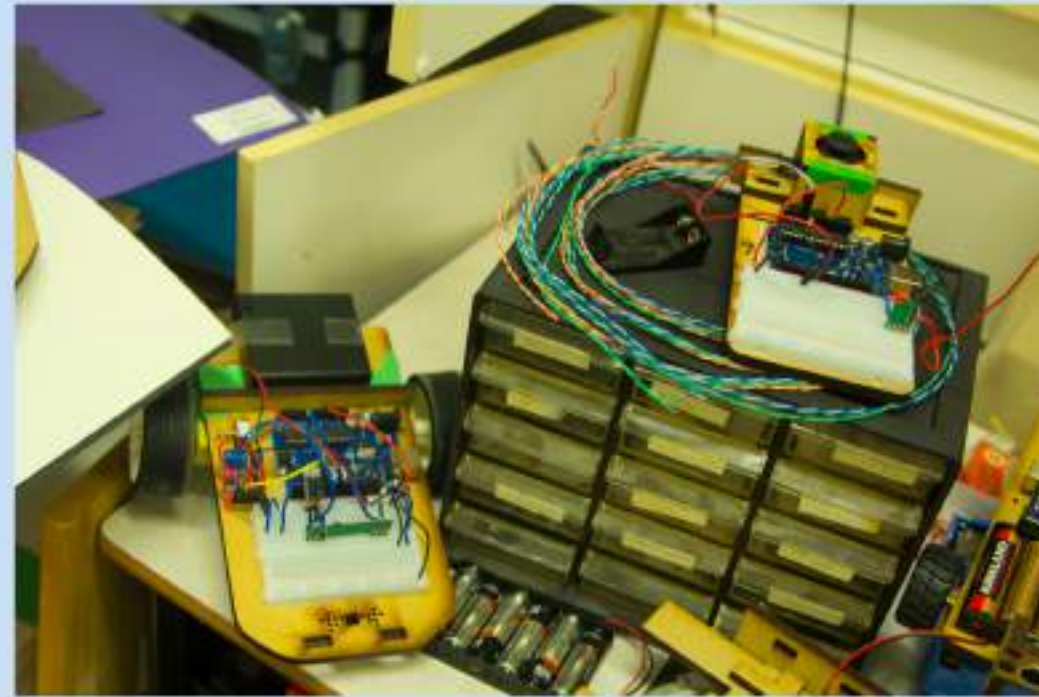
NON usan impresora 3D. Prefiren utilizar para os seus proxectos unha cortadora láser e construír por exemplo: coches programábeis mediante arduínos e os mandos a distancia para dirixilos.