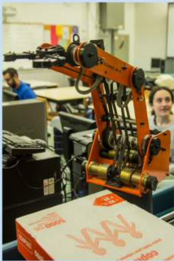
exemplos de tecnoloxía para aplicar nas aulas

O instituto Sir Wilfred Laurier está moi orientado á tecnoloxía. Velaquí tedes unha mostra do seu laboratorio de robótica.