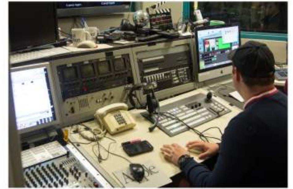
Mesa de Realización