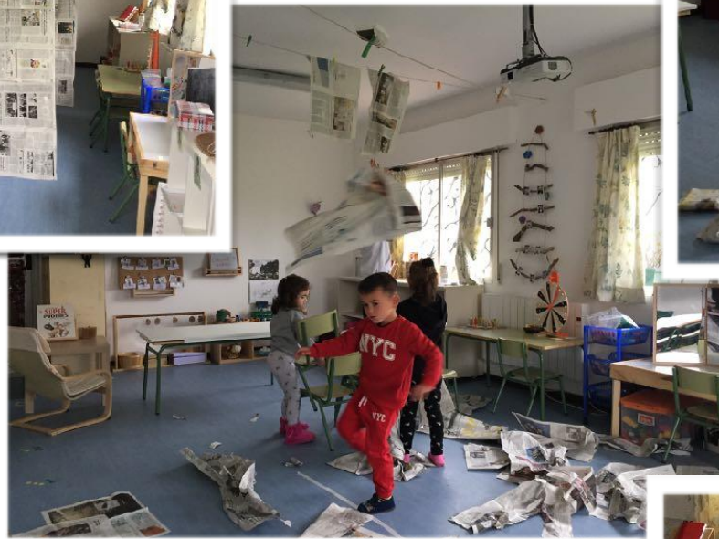
Xogo con papel de xornal