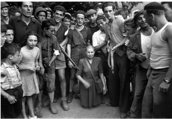
Mulleres acusadas de colaboracionismo