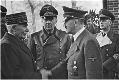
Pétain e Hitler en 1940