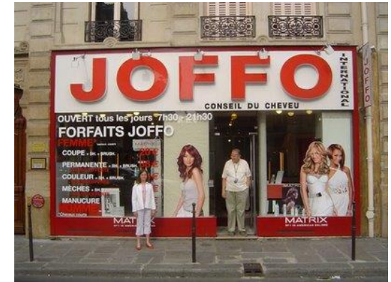
O negocio familiar nos últimos anos.

Joffo, un perruqueiro xudeu establecido no París ocupado polos nazis, decide dispersar a súa familia para evitar o cruel destino que lles agarda. Os seus fillos, Joseph e Maurice, con dez e doce anos, deben sobrevivir sós e fuxir en busca da liberdade unha vez que seus pais son detidos pola Xestapo. A amizade, a picaresca e o medo marcan a súa supervivencia.