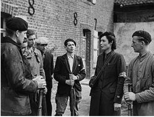
Grupo de maquis