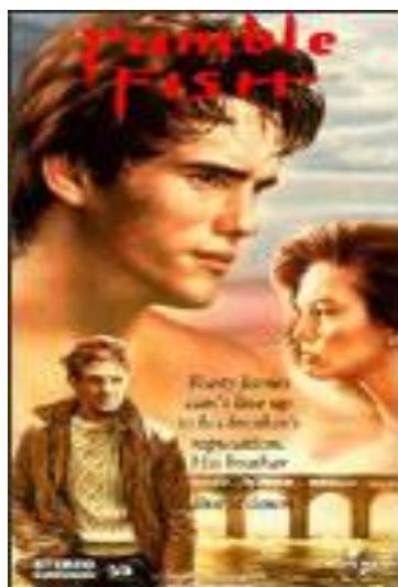
Rumble Fish . (1975) Coppola