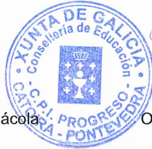
Olalla Otero Payno