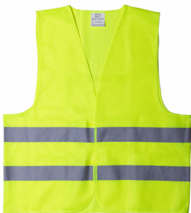
Chaleco identificador do Xefe de Emerxencia