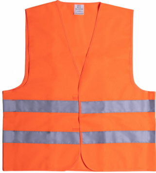
Chaleco identificador do E.A.E.