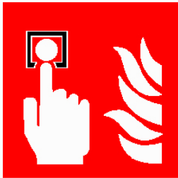
Ideograma Pulsador de Alarma