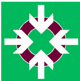
Ideograma Aula de Confinamento