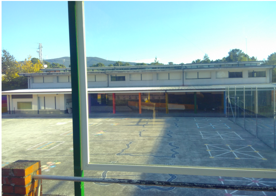
Imaxe da explanada do Punto de Encontro