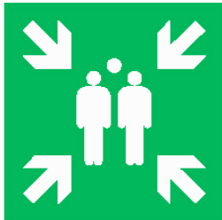
Ideograma Punto de Encontro