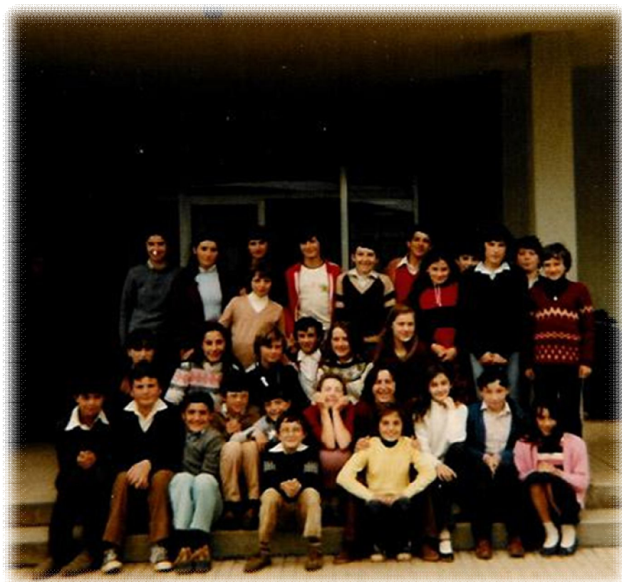
foto da clase, todos sorrín esperanzados no porvir.