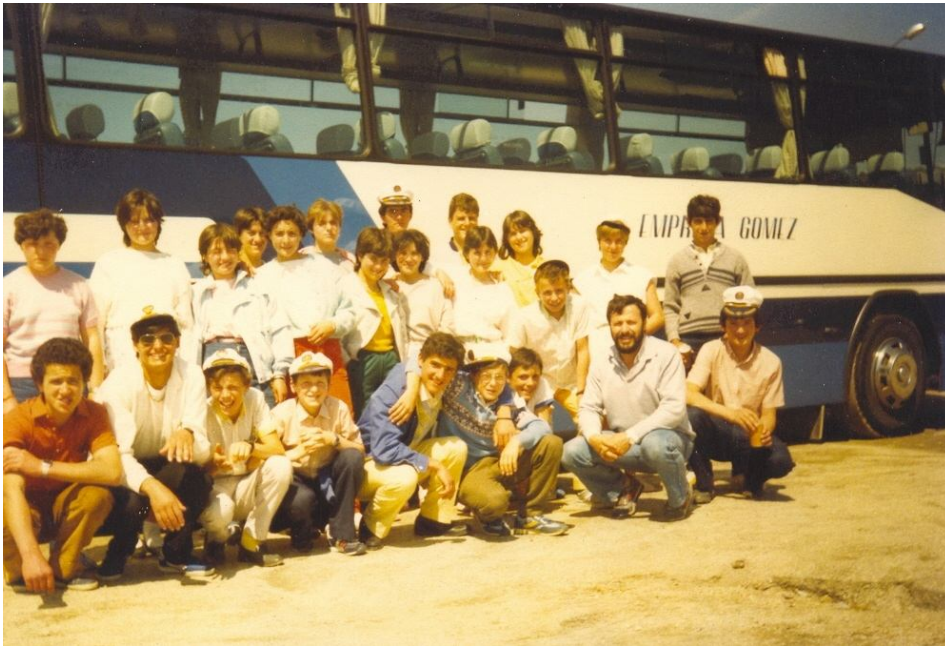
Foto de excursión. O transporte escolar Autos Gómez de Mesía. Mirade hoxe cantos papás hai sendo alumnos.