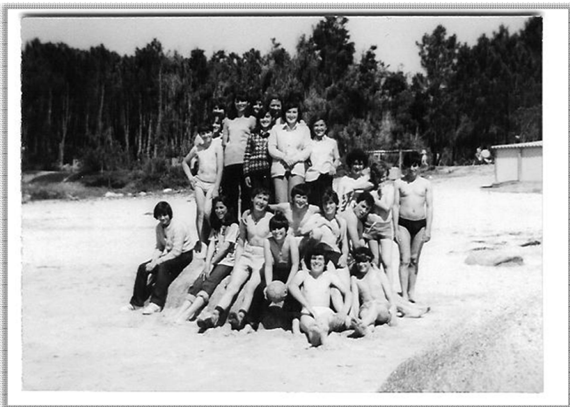
Foto dunha excursión, antes do baño na praia.