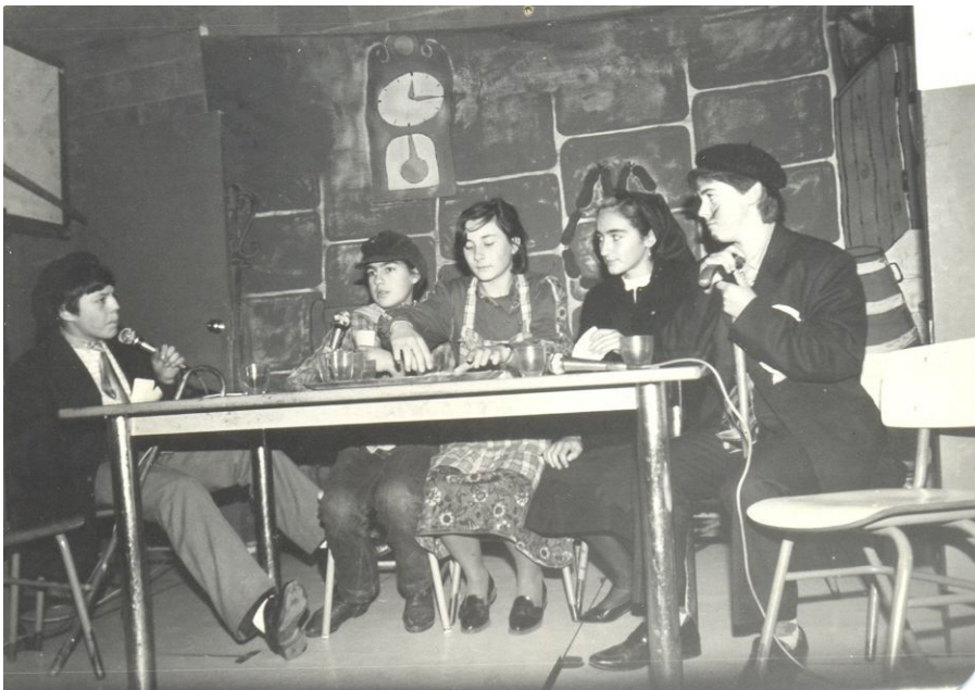
Representación dunha obra de teatro, nunha festa do Entroido, no Pavillón.