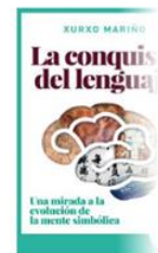
La conquista del lenguaje. Una mirada a la evolución de la mente simbólica