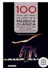
100 cosas que tienes que saber de la música clásica