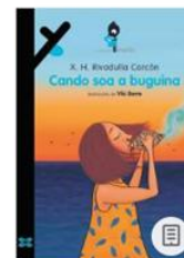
Cando soa a buguina