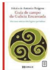
Guía de campo da Galicia Encantada