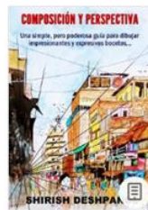
Composición y perspectiva: Una mirada