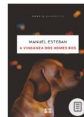
A vinganza dos homes bobos