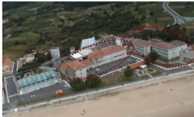
CENTRO INTEGRADO DE FORMACIÓN PROFESIONAL COROSO

Rúa dos Estudantes, 5. 15960 Ribeira Tif: 881866874/881866878 Fax: 881866885 www.edu.xunta.es/centros/cifpcoroso/ Email: cifp.coroso@edu.xunta.es