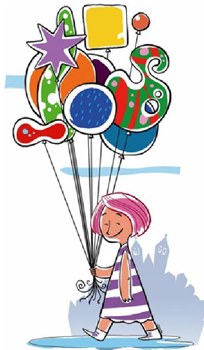
Ilustración: Xosé Tomás

E colorín colorado...este conto nunca estará reamatado.