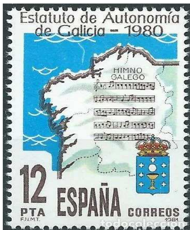
Selo de 1981 do Estatuto de Autonomía de Galicia, co mapa de Galicia, a partitura do himno e o escudo.