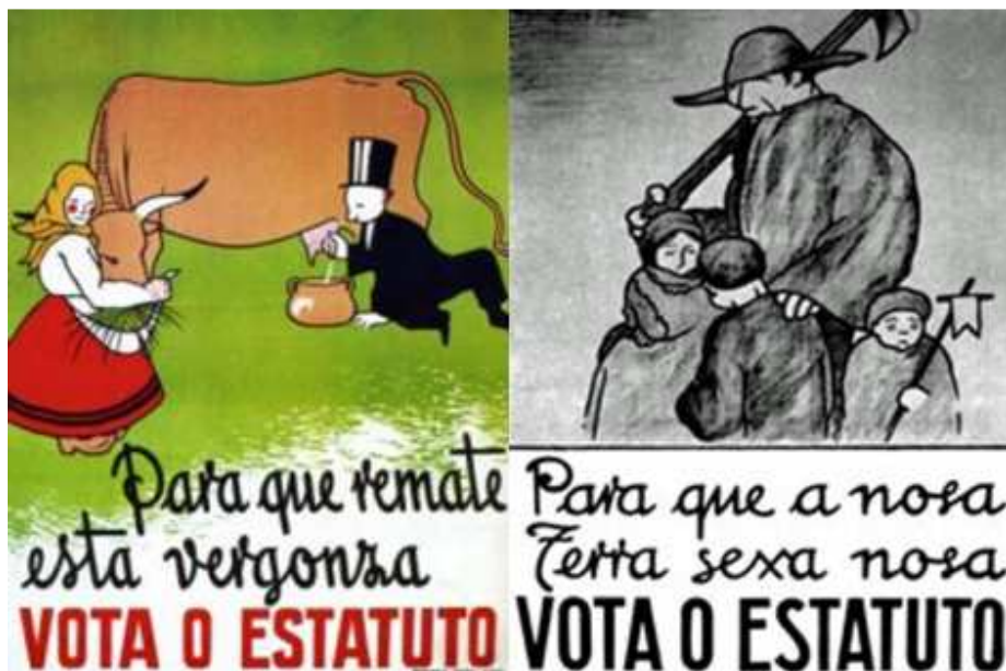
Carteis de Castelao para a campaña estatutaria.

Posteriormente, e no ámbito da Constitución Española de 1978, aprobouse en 1981 o Estatuto de Autonomía de Galicia, que é a norma institucional básica da Comunidade Autónoma de Galicia.