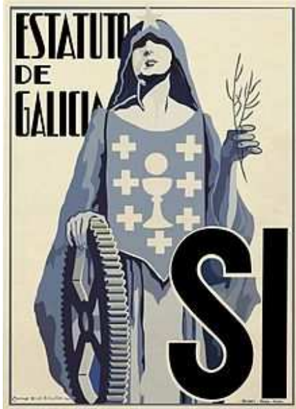
Cartel realizado por Camilo Díaz Baliño