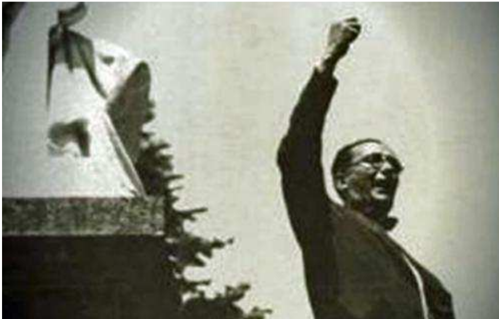
Castelao, nun dos seus mítins, apoiando o Estatuto.