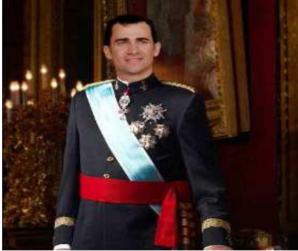
Felipe de Borbón

O rei é o xefe de Estado pero non goberna