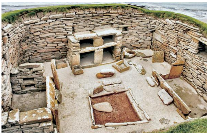
Interior dunha casa neolítica

Adoitaban estar rodeados con muros de canas e barro. No interior había cabanas construídas con barro e palla.