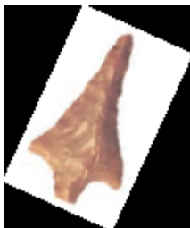
Punta de frecha

Fabricaban instrumentos con materiais como pedra, madeira, óso e corno. Facían coitelos, machados, lanzas, frechas, arpóns, anzois, agullas, etc.