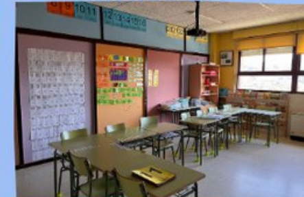
AULA DE PT