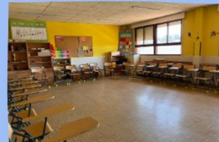
AULA DE MÚSICA