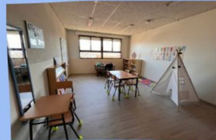
AULA DE AL