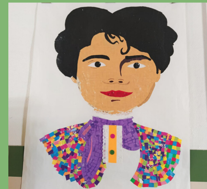
MURAL DE ROSALÍA CON PLÁSTICOS