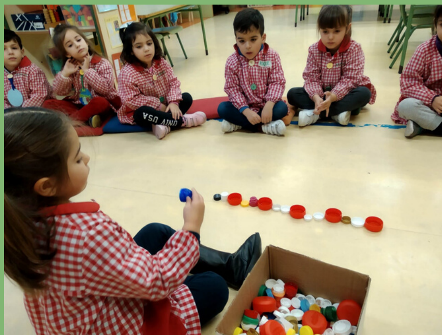
RECOLLIDA DE TAPÓNS