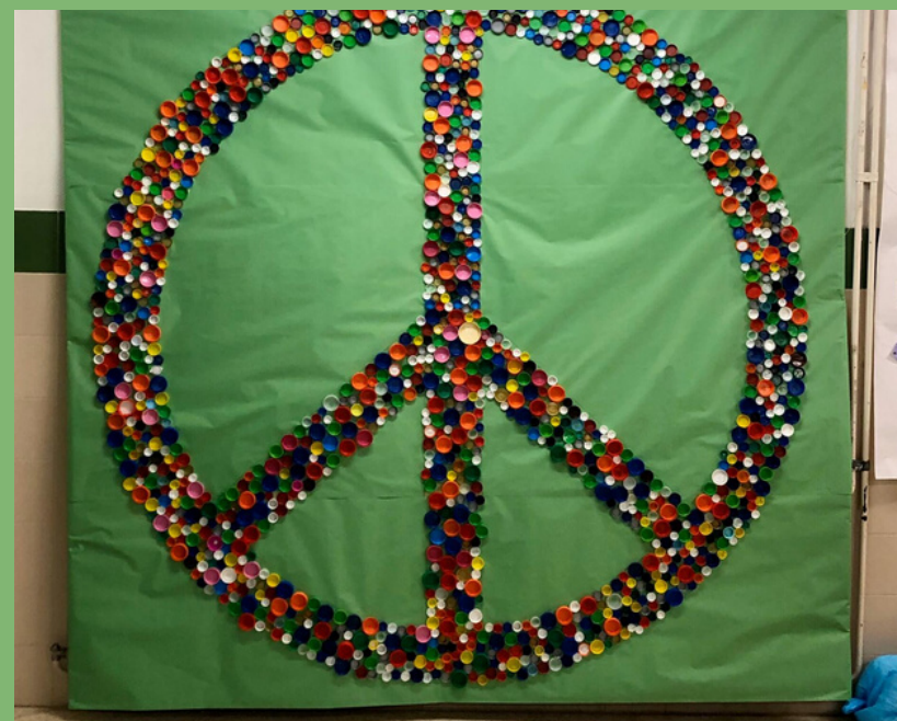
1000 TAPÓN FORMANDO O SÍMBOLO DA PAZ