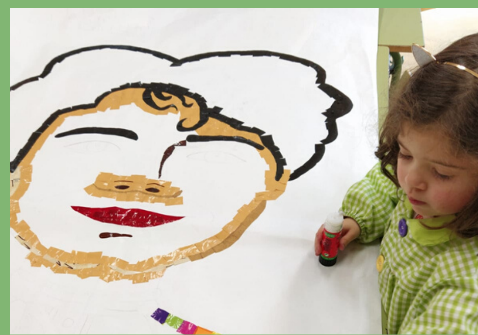
CONFECCIÓN DO MURAL