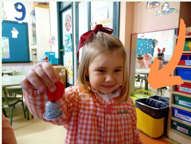
Colectores de reciclaxe nas aulas