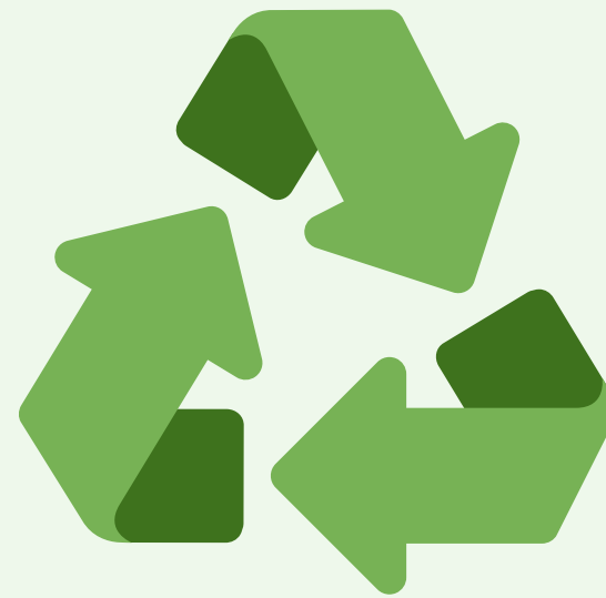
"Os 3 Erres"