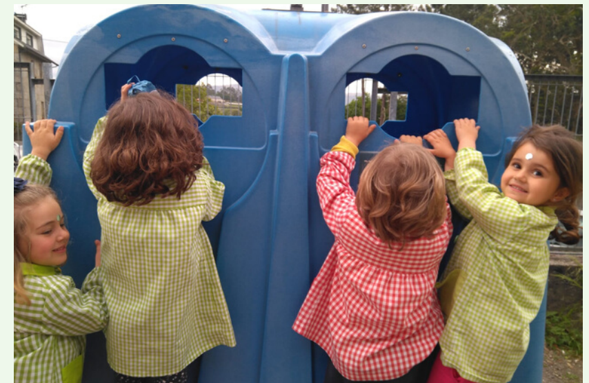
Reciclamos por quendas