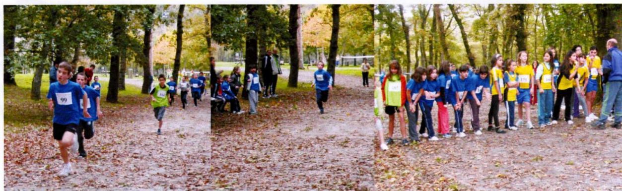
Campo a través na Fraga das Pontes