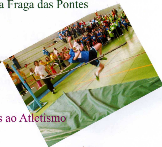
Xogamos ao Atletismo