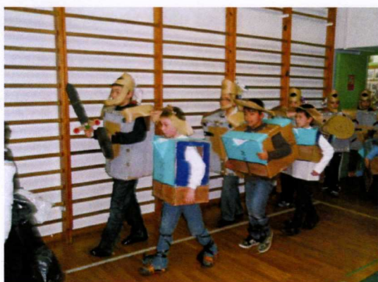
Fixemos gorros e vistosos helmets con papel de envolver ou de revistas.