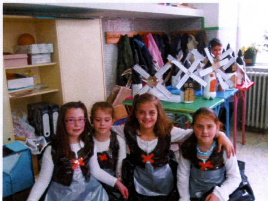
Os nosos traxes eran bolsas de plástico, as de lixo grandes para facer as faldas e as pequenas para o chaleco e o mandil.