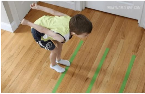
Salto de lonxitude