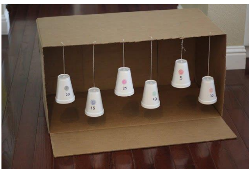
Xogo de puntería

Podemos entreternos fabricando infinidade de xogos sinxelos. Aí van unhas cantas ideas: