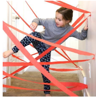
Camiños de obstáculos