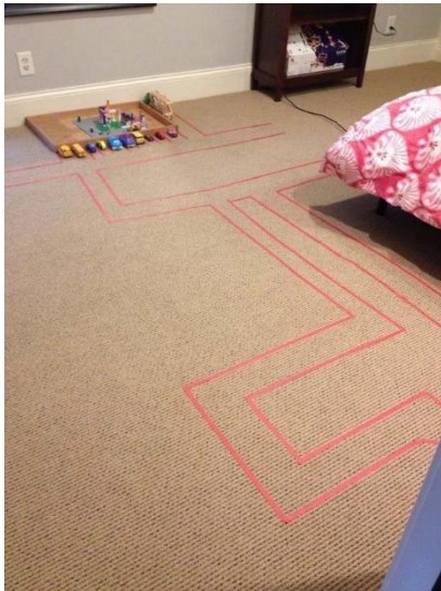
Facer circuitos con cinta illante para xogar cos coches