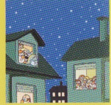
Casas de Teo.