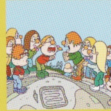
Petróglifo de Outeiro do Corno I.