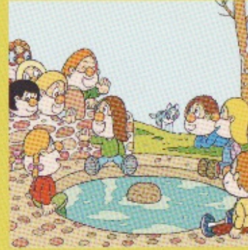
A burga de Xermeade.