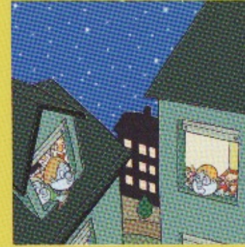
Casas de Teo.