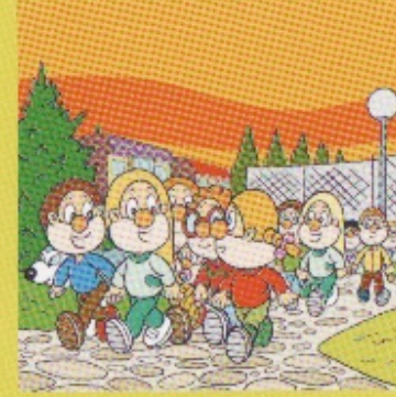
Parque dos Tilos.