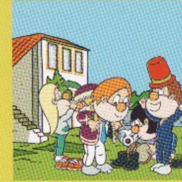
Escola vella de Rarís.