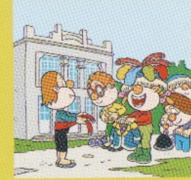
Centro social e recreativo de Luou.