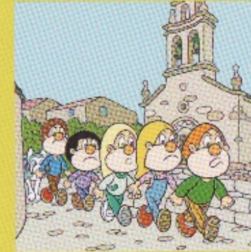
Igrexa de Lampai.