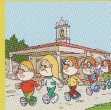
Capela das Cabezas. Raxó.