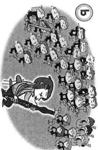
Marcha das vasoiras (O aprendiz de bruxo) de Paul Dukas .