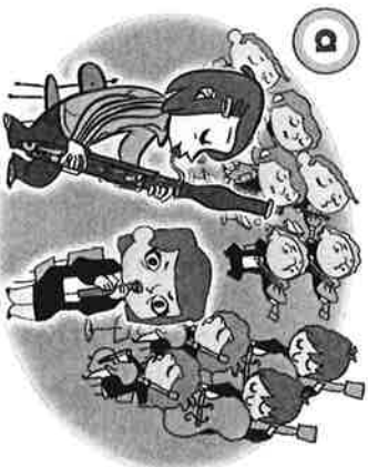
Concerto para frauta de pico e fagot de Georg Telemann .