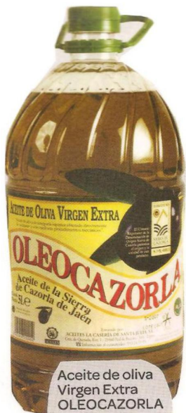
Aceite de oliva Virgen Extra OLEOCAZORLA 5l 11,95€ El litro sale a 2,39€