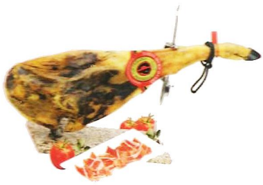
Jamón ibérico de cebo de Salamanca CEFERINO PARRA. Pieza de 7,5 a 8,5 kg.