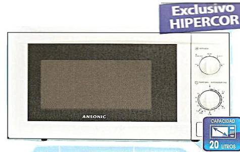
Microondas ANSONIC MAMG2010. Temporizador hasta 3 min, con grill,