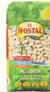
0,99€ Alubias Largas EL HOSTAL, 500 g. El kg. le sale a 1,98 €