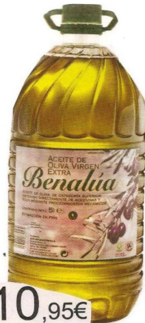
Aceite de oliva Virgen Extra BENALÚA 5l 10,95€ El litro sale a 2,19€