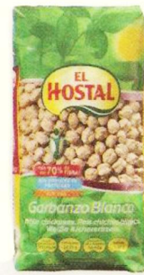
1,29€ Garbanzos Lechosos EL HOSTAL, 500 g. El kg. le sale a 2,58 €