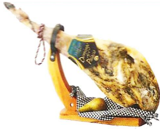
Jamón ibérico de cebo DOMINGO DEL PALACIO. Pieza de 7,5 a 8,5 kg.