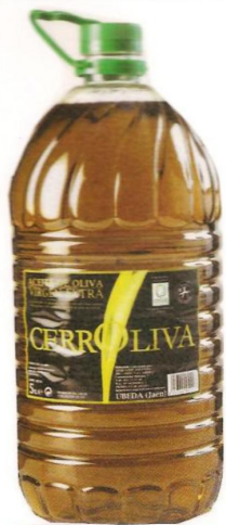
Aceite de oliva Virgen Extra CERROLIVA 5l 10,95€ El litro sale a 2,19€