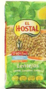
0,79€ Lentejas Castellanas EL HOSTAL, 500 g. El kg. le sale a 1,58 €