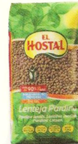
0,85€ Lentejas Pardiñas EL HOSTAL, 500 g. El kg. le sale a 1,70 €