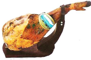
Productos ibéricos de cebo CUMBRES IBÉRICA. Jamón, pieza de 7,8 a 8,2 kg (1). Paleta, pieza de 4 a 5 kg (2).