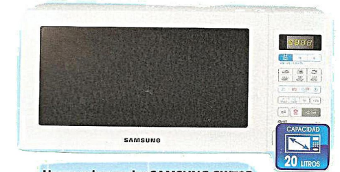
Horno microondas SAMSUNG GW73B. Con grill simultáneo, mandos digitales,