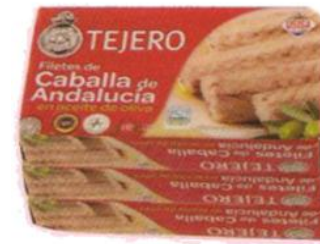
Caballa en aceite de oliva TEJERO 78 g x 3