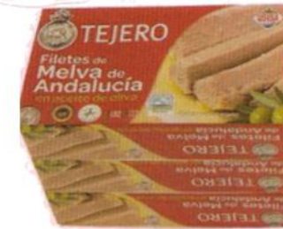
Melva en aceite de oliva TEJERO 78 g x 3 uds.