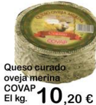
Queso curado oveja merina COVAP El kg. 10,20 €