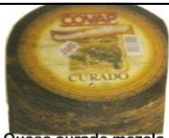
Queso curado mezcla COVAP El kg. 8,95 €