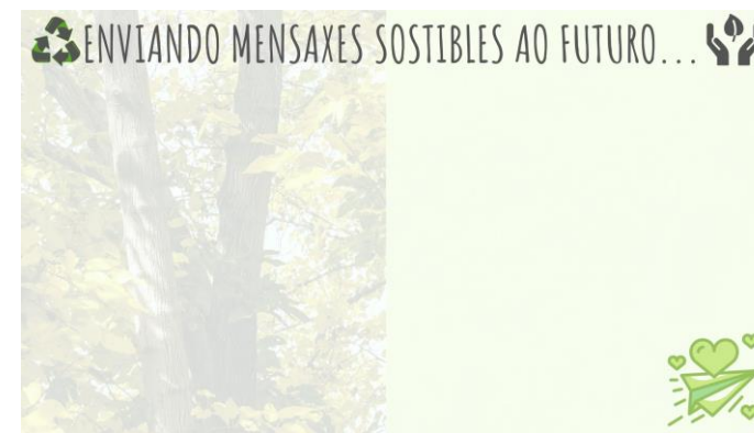
SOPORTE 5. Mensaxes sostibles.