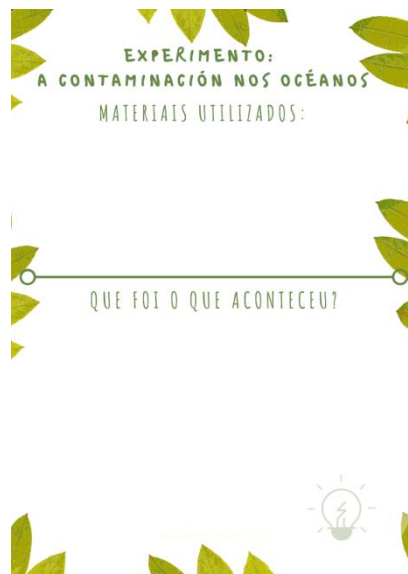
SOPORTE 3. Recollida datos experimento.