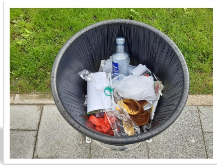
IMAXE 1. SOPORTE PARA A ACTIVIDADE INICIAL DE VEXO-PENSO-PREGÚNTOME