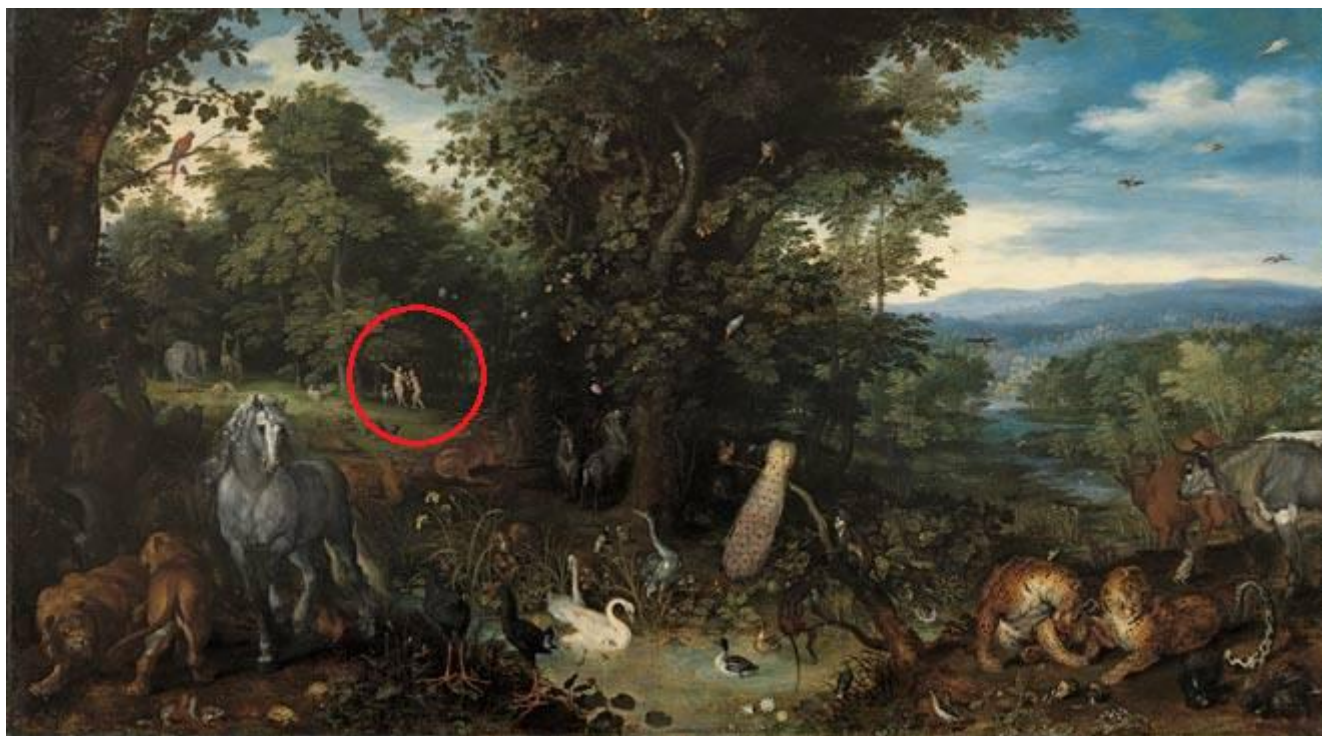
Jan Brueghel, el Viejo, El Jardín del Edén (1610-1612) Barroco Museo Nacional Thyssen (Madrid)

1.- Quen son as dúas figuras rodeadas por un círculo vermello que aparecen no cadro?