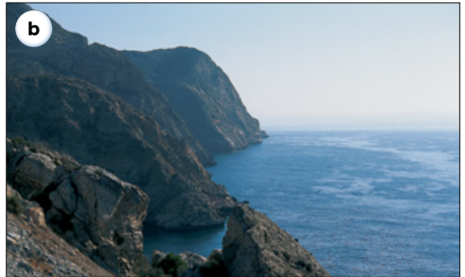
Costa mediterránea andaluza.