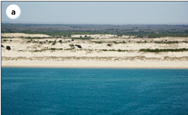
Costa atlántica andaluza.

7 Establece diferenzas entre a costa atlántica e a mediterránea andaluzas.