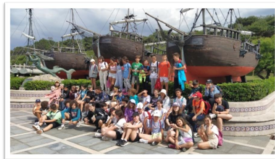
EXCURSIÓN FIN DE ETAPA 2022/23

AVDA. BUENOS AIRES, S/N 36002 PONTEVEDRA Tlfnos. 886 15 19 37 / 886 15 19 39