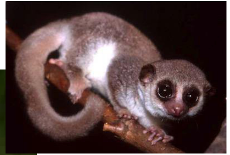
Lémur aye aye

A pesar de sus diferencias, los lémures tienen mucho en común. Muchos de ellos tienen el cuerpo delgado, la nariz puntiaguda, y unos ojos enormes. Algunos, como los aye aye son nocturnos, es decir, salen de noche a buscar su alimento, que consiste en plantas y crías de insectos. Otros, como los indri, son diurnos y están activos durante las horas de luz. El indri es el lémur más grande. Este lémur no come carne ni insectos. Es herbívoro, es decir, come hojas, flores y frutas y también, ¡tierra!