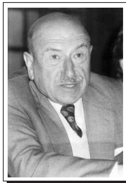
RICARDO CARVALHO CALERO

Polo seu labor en defensa do idioma e cultura galega a Real Academia Galegas dedícalle o Día das Letras.