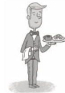
ser ..... ir