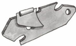
a ..... relatas

3 Completa as palabras que representan estes debuxos con b ou con v .