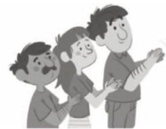
pú b lico