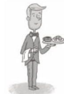
ser v ir