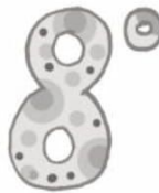
oita v o