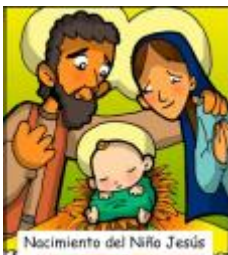
Nacimiento del Niño Jesús

Después de que el ángel Gabriel fuera a verla, María fue a visitar a su prima Isabel para ayudarla hasta que nació su hijo, que de mayor todos lo conocieron como Juan el Bautista.