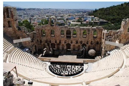
O Odeón de Herodes Ático