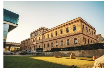
Museo da Acrópolis