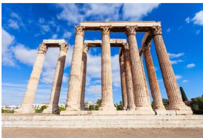
Templo de Zeus Olímpico