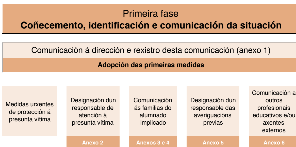
Cadro 1. Esquema da primeira fase do protocolo.

De apreciarse indicios de delito ou falta penal en calquera momento do proceso, notificarase ao ministerio fiscal e aos servizos de protección de menores (con traslado á administración educativa) para a súa valoración. No caso de iniciarse un proceso penal, o centro suspenderá as actuacións en tanto este non se resolva.