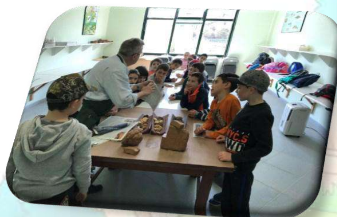
Brañas de Valga