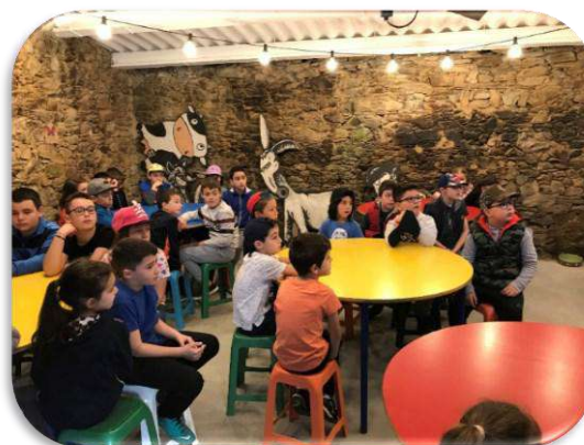
Casa grande de Xanceda