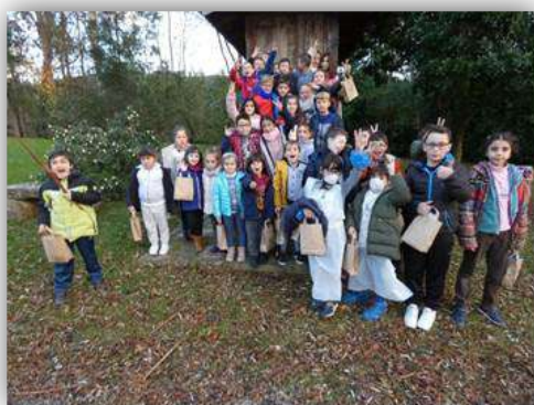
O enredo do abelleiro