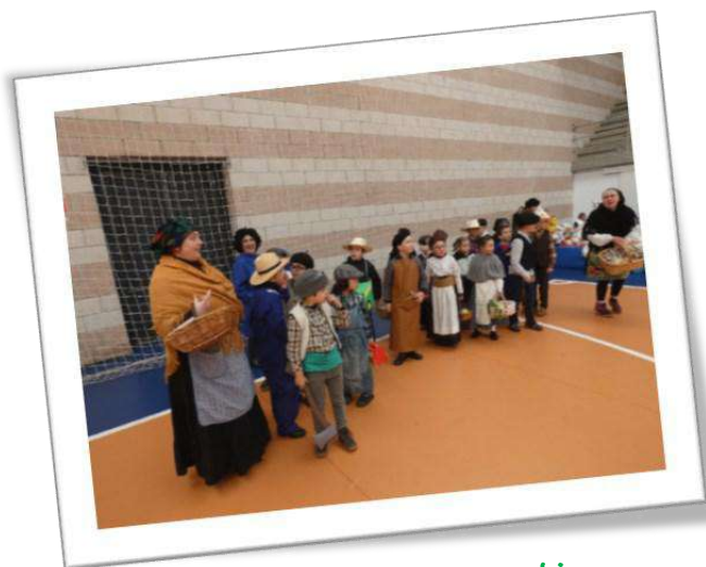
Entroido en Curtis