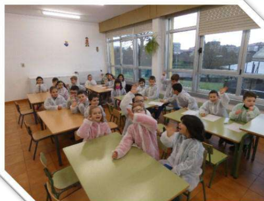
Facendo un boliño de pan