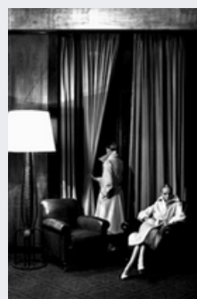
Helmut Newton Marc Bohan for Christian Dior, French Vogue, March 1978