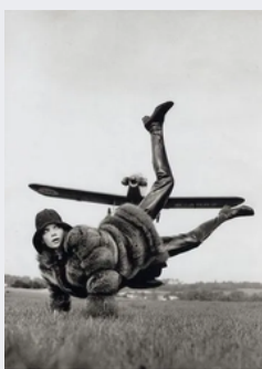
Helmut Newton Mansfield, British Vogue, 1967 London