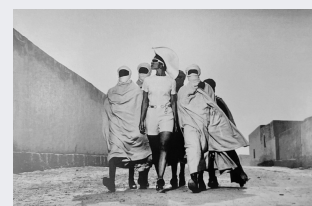
Helmut Newton British Vogue, Strelitz, Tunisia, 1967.