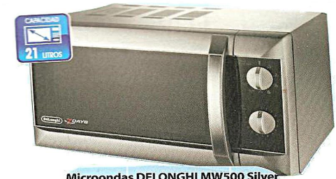
Microondas DELONGHI MW500 Silver Analógico, grill simultáneo,