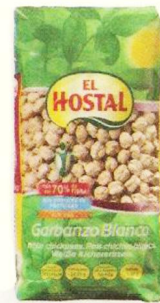
1,29€ Garbanzos Lechosos EL HOSTAL, 500 g. El kg. le sale a 2,58 €