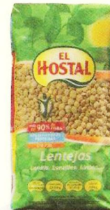
0,79€ Lentejas Castellanas EL HOSTAL, 500 g. El kg. le sale a 1,58 €