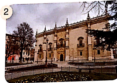
Palacio de Santa Cruz