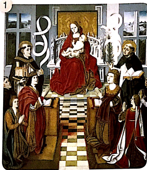
Virgen de los Reyes Católicos

El reinado de los Reyes Católicos fue una época de transición entre diferentes estilos artísticos.