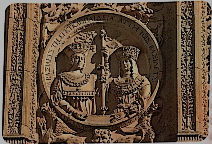
Fernando e Isabel

Aragón se había extendido por el mar Mediterráneo y poseía los reinos de Cerdeña , Nápoles y Sicilia , en Italia.