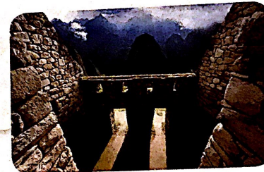
Machu Picchu, ciudad fortificada inca

Los incas vivían en Perú, a lo largo de la cordillera de los Andes. Construyeron grandes ciudades de piedra, canales y acueductos.