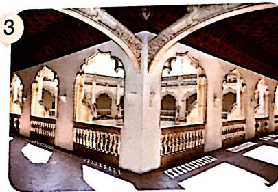
Claustro de San Juan de los Reyes