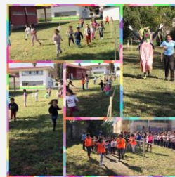
Inauguración Circuito Milla