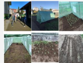
A horta de Lúa