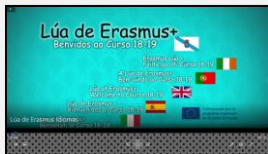
Video Lúa Presentación