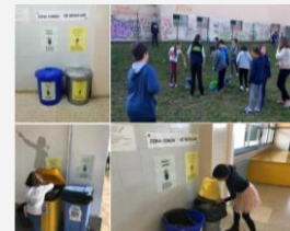
Crease o Equipo Ecolóxico