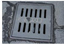
Sumidoiro de Roma co emblema SPQR.

http://commons.wikimedia.org/wiki/File:R.I.P..jpg