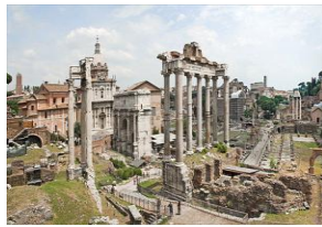
No primeiro plano o templo de Saturno (no centro), o templo de Vespasiano (á esquerda), o arco de Septimio Severo (entre os dous templos), a basílica Iulia (á dereita).

http://upload.wikimedia.org/wikipedia/commons/thumb/a/ab/Codex_Nitriensis%2C_f.20r_%28Syriac_text%29.jpg/619px-Codex_Nitriensis%2C_f.20r_%28Syriac_text%29.jpg