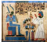
O deus Osiris recibindo ofrendas. Papiro exipcio. Jon Bodsworth. British Museum.

http://it.wikipedia.org/wiki/File:Papiro-Ciane.jpg