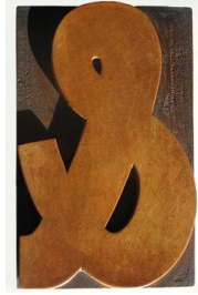
Ampersand tipográfica en bosque de 21 cm de altura.

http://commons.wikimedia.org/wiki/File:Esperluette_en_bois.JPG