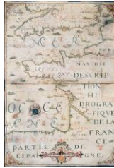
Mapa hidrográfico de Francia en dous pergamiños unidos. Dieppe 1627.

http://upload.wikimedia.org/wikipedia/commons/d/da/Joshua_Roll.jpg