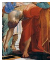
Arquimedes estuda a xeometría nun detalle do fresco A escola de Atenas . Rafael Sanzio. 1509. Museos Vaticanos.

http://upload.wikimedia.org/wikipedia/commons/f/f8/M73_13.jpg