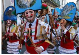
Cigarróns típicos do Entroido de Verín.

http://upload.wikimedia.org/wikipedia/commons/9/94/Cigarrones.jpg