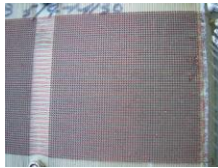
Memoria dun ordenador dos 80 onde se poden ver os bits físicos.

http://en.wikipedia.org/wiki/File:Key_delete.jpg