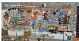
Graffiti no Fórum Internacional das Culturas Barcelona, 2004.

http://gl.wikipedia.org/wiki/Ficheiro:Banditaccia_Sarcofago_Degli_Sposi.jpg