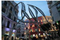
Escultura en Málaga que simboliza o Pantokrator . Blanca Muñoz, 2008.

http://commons.wikimedia.org/wiki/File:Maserati_GranCabrio_Sport_at_the_Frankfurt_Motor_Show_IAA_2011_%286146827649%29.jpg