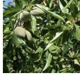
Améndoas na árbore.

http://upload.wikimedia.org/wikipedia/commons/thumb/b/b4/Peppermint-tea_hg.jpg/278px-Peppermint-tea_hg.jpg