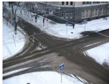
Encrucillada en inverno. Cracovia.