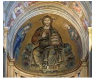
Cristo Pantocrátor mosaico de estilo bizantino da Catedral de Cefalú, Sicília.

http://commons.wikimedia.org/wiki/Image:Scuola_di_atene_23.jpg?uselang=it