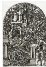
A caída de Babilonia. Jean Duvet, circa 1555.

http://en.wikipedia.org/wiki/File:Velazquez_Sibyl_Meadows_Museum.jpg