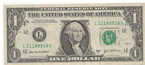
Billete de dólar. Wikipedia. Hohum.

http://upload.wikimedia.org/wikipedia/commons/thumb/5/56/Ampersand.png/320px-Ampersand.png