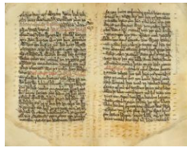
O texto superior do palimpsesto con texto siríaco, folio 20 recto

http://commons.wikimedia.org/wiki/File:Esperluette_en_bois.JPG