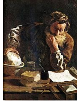
Arquimedes pensativo. Domenico Fetti.

http://upload.wikimedia.org/wikipedia/commons/thumb/e/e7/Domenico-Fetti_Archimedes_1620.jpg/768px-Domenico-Fetti_Archimedes_1620.jpg