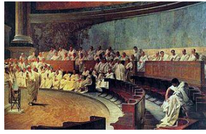
Cicerón desenmascara a Catilina. Cesare Maccari. (1840-1919).

http://commons.wikimedia.org/wiki/File:Maccari-Cicero.jpg