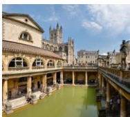
Antigos baños romanos en Bath, Inglaterra .

http://en.wikipedia.org/wiki/File:Inscripci%C3%B3n dentro de un lupanar de Pompeya.jpg