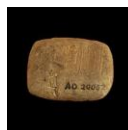
Anotación dos salarios diarios selados por un alto funcionario. Ur, Mesopotamia.