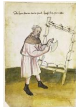
Fabricante de pergameos na casa de Nurembergaio redor do 1425.

http://upload.wikimedia.org/wikipedia/commons/8/8d/Christ_with_beard.jpg