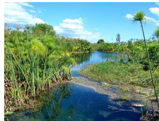
A máis grande colonia europea de papiro. Beiras do río Ciane, Siracusa.

http://commons.wikimedia.org/wiki/File:Fuellfederhalter.jpg