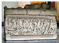
Sarcófago de mármore. Museo Arqueolóxico de Tesalónica.

http://upload.wikimedia.org/wikipedia/commons/thumb/2/28/Statue_Nemesis_Louvre_Ma4873.jpg/208px-Statue_Nemesis_Louvre_Ma4873.jpg