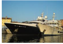
Barco de luxo en Saint Tropez

http://upload.wikimedia.org/wikipedia/commons/thumb/e/e7/Domenico-Fetti_Archimedes_1620.jpg/768px-Domenico-Fetti_Archimedes_1620.jpg