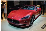
Maserati Gran Cabrio Sport . Feira do motor de Frankfurt.

http://commons.wikimedia.org/wiki/File:Christ_Pantokrator,_Cathedral_of_Cefalù%3%B9,_Sicily.jpg