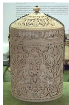
Bote de Zamora. Obra de arte califal cordobés. Exemplo de horror vacui .

http://commons.wikimedia.org/wiki/File:Scroll.jpg