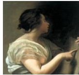
Sibila con tabula rasa. Diego Velázquez.

http://commons.wikimedia.org/wiki/File:ManholeSPQR.JPG