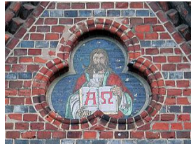
Cristo sostén un libro cos signos alfa e omega. Detalle do frontal dunha igrexa en Kiel. Christoph Mewes.

http://commons.wikimedia.org/wiki/File:Friedberg_ABC-Buch.jpg