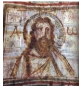
As letras gregas alpha e omega rodean o halo de Xesús

http://upload.wikimedia.org/wikipedia/commons/9/9d/050402Zepepeq.JPG