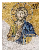
Cristo pantócrator nun mosaico na Basílica de Santa-Sofía (Estambul, Turquía).

http://upload.wikimedia.org/wikipedia/commons/thumb/3/38/Bote_de_Zamora_%28M.A.N._Madrid%29_01.jpg/507px-Bote_de_Zamora_%28M.A.N._Madrid%29_01.jpg