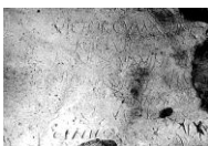
Graffiti de contido erótico nun lupanar de Pompeia .

http://commons.wikimedia.org/wiki/File:Mur de tags au Forum de Barcelone.jpg