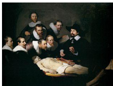
Diseción dun cadáver. Lección de anatomía . Rembrandt. 1632.

http://it.wikipedia.org/wiki/File:Rembrandt - The Anatomy Lecture of Dr. Nicolaes Tulp - WGA19139.jpg