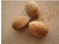
Améndoas con casca.