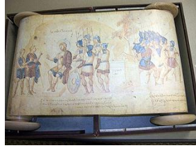
O Joshua Roll. S. X. Biblioteca do Vaticano.

http://upload.wikimedia.org/wikipedia/commons/d/da/Joshua_Roll.jpg