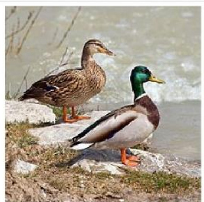
Parella (femía e macho) de lavancos reais.

Rematado o Entroido, en "Radio Rosiña" comezamos a gravar os programas nos que explicamos os motivos polos que eliximos o disfraz que luciu cada un dos grupos do cole. En 5º e 6º facíalles especial ilusión o dos patos, partindo do coñecidísimo conto "O patinho feo". Pero a partir de aí, ademais de recortar e pegar un montón de plumas no seu disfraz, descubriron outras moitas cousas sobre estas coñecidas aves, que quixeron contarnos neste programa