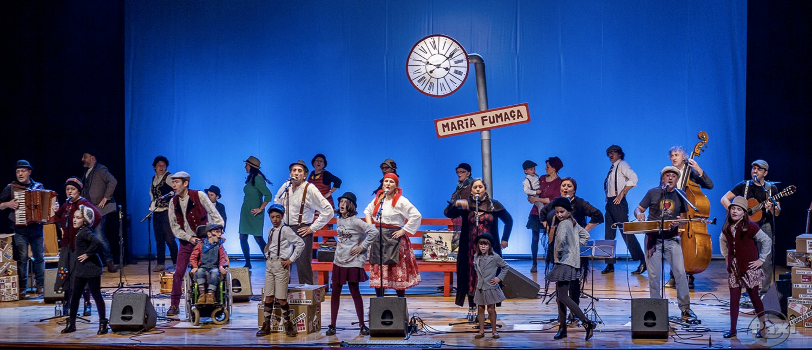
María Fumaça (como se fixo)