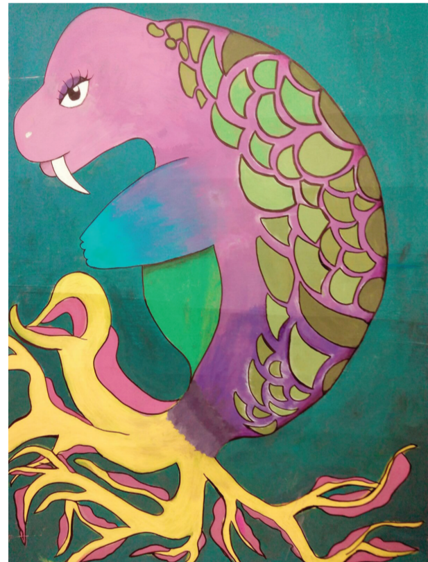
O 10 de febreiro, no mar Vermello, cazamos unha vaca mariña.