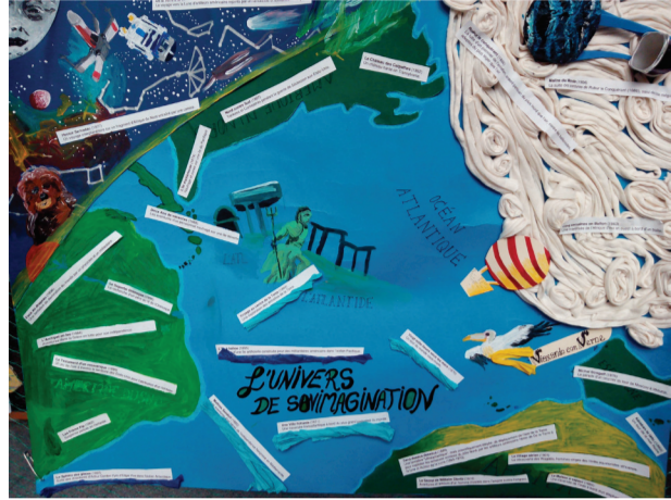
L'univers de son imagination