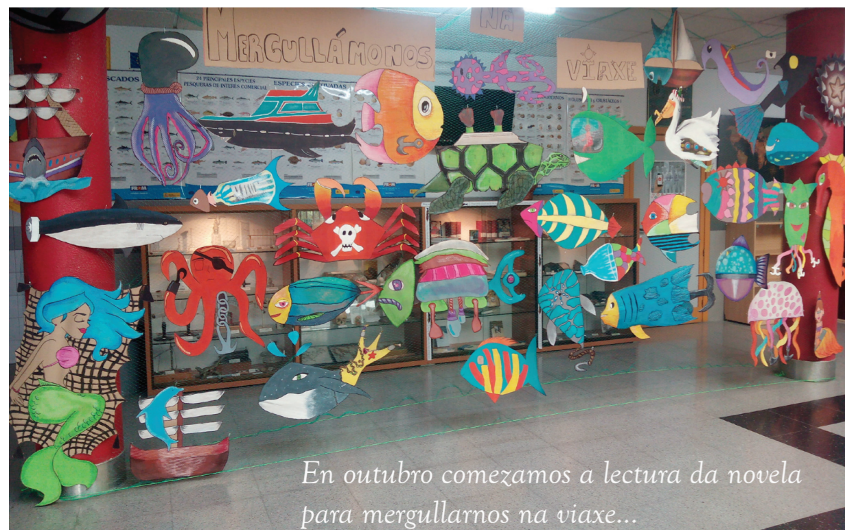
En outubro comezamos a lectura da novela para mergullarnos na viaxe...