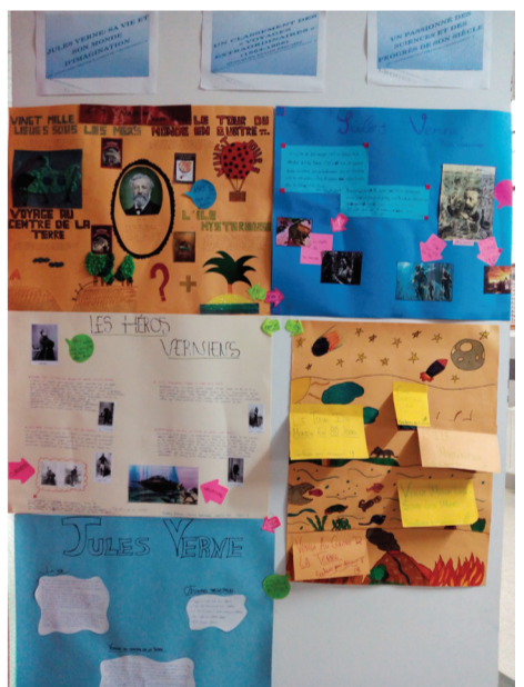
Nous travaillons sur la vie de Jules Verne et nous classons ses romans