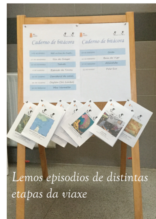
Lemos episodios de distintas etapas da viaxe