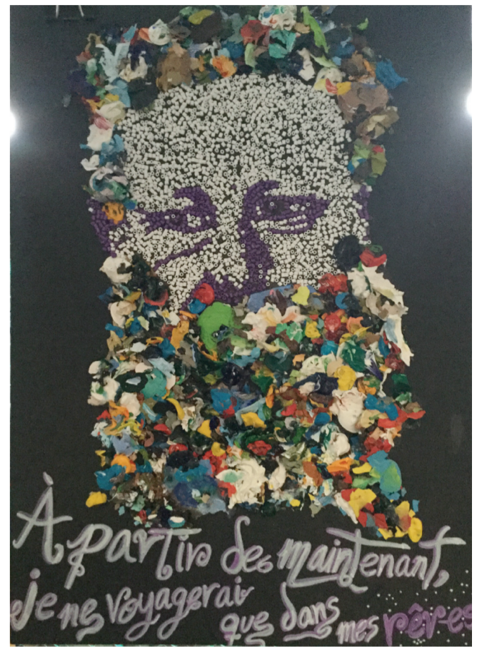
A partir de maintenant, je ne Voyagerai que dans mes rêves.