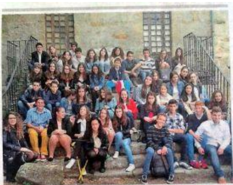
CAMPEONATO DE ORATORIA DE PRIMERO DE ESO