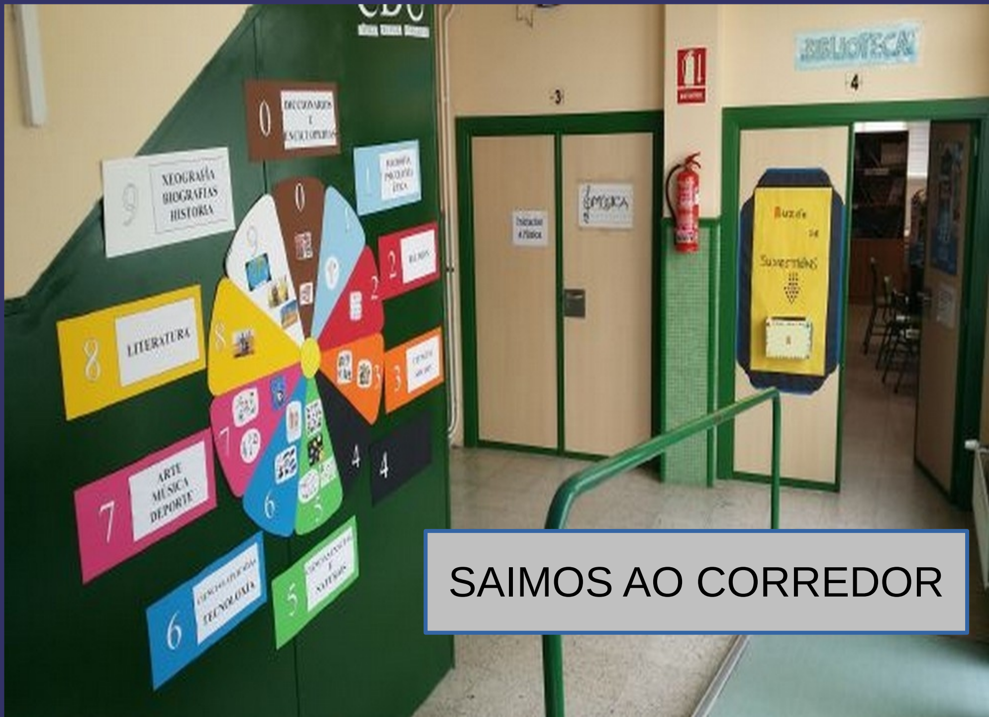
SAIMOS AO CORREDOR