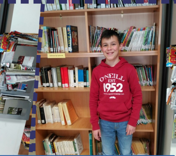
COLABORACIÓN CON IES E BPM