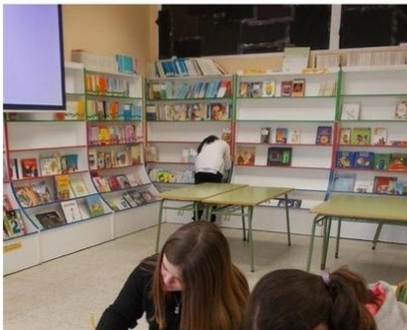
Das alumnas voluntarias en la biblioteca del CEIP Nicolás del Río

Biblioteca Carlos Labraña CEIP Nicolás del Río