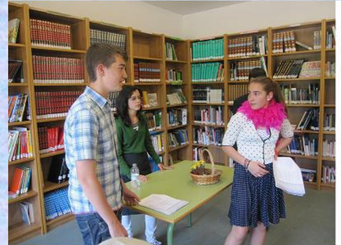
Representación da obra Luces de Bohemia