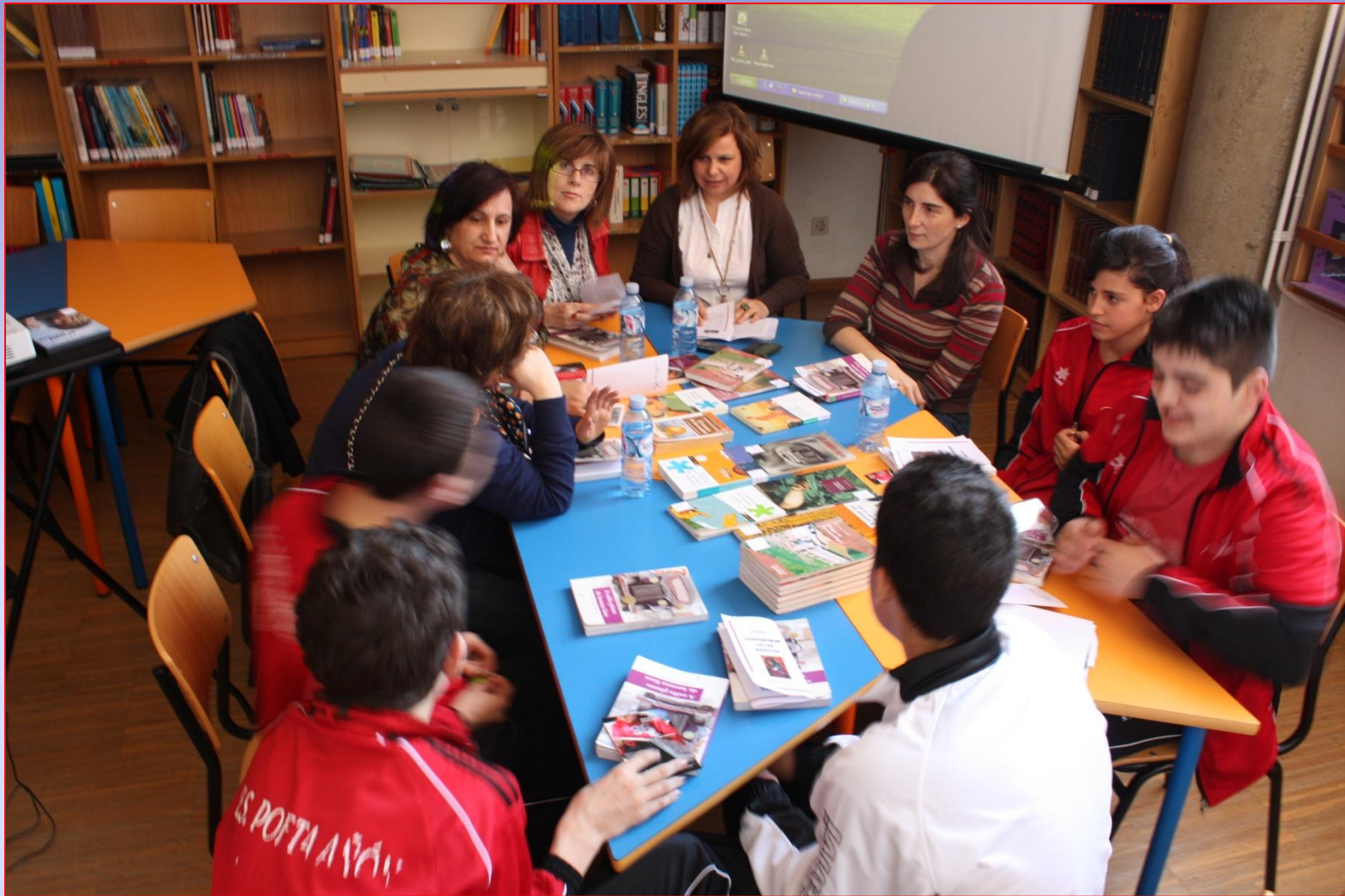
CLUB DE LECTURA IES POETA AÑÓN OUTES (A Coruña)