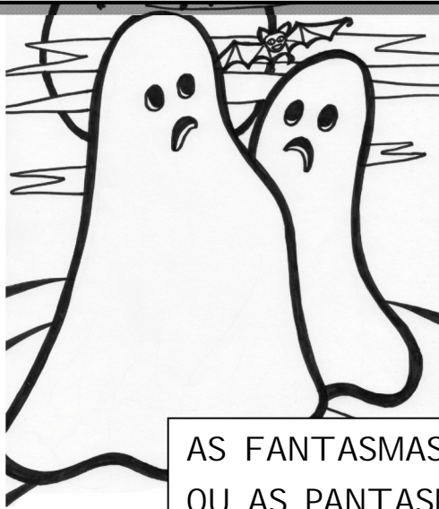
AS FANTASMAS OU AS PANTASMAS