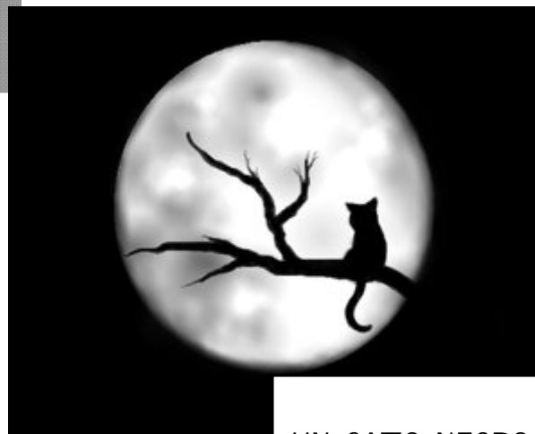
UN GATO NEGRO