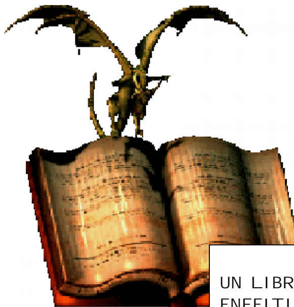
UN LIBRO DE ENFEITIZOS