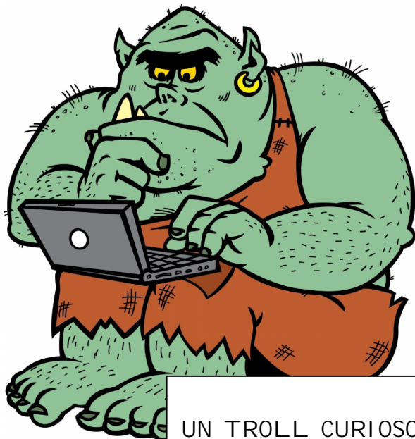
UN TROLL CURIOSO