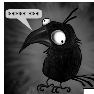
UN CORVO NEGRO

BIBLIOTECA XOÁN FARIAS ¿ESCRIBIMOS UN CONTO DE MEDO?