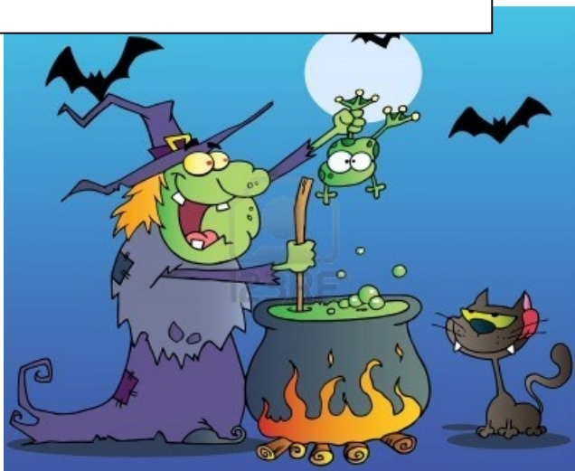
MARMITA CUNHA APÓCEMA